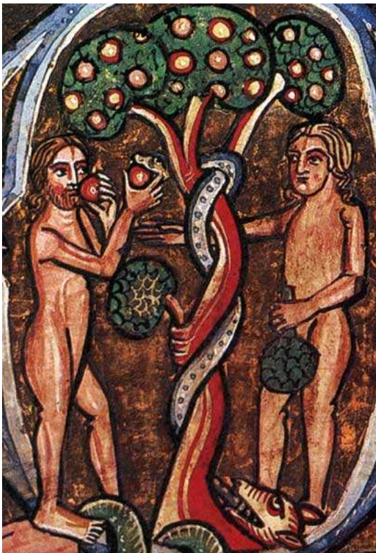
Met de vrucht van de boom van kennis van goed en kwaad begon de splitsing.

Op het moment dat Adam en Eva beseften dat zij een man en een vrouw waren, ging het paradijs verloren. Sindsdien zijn wij mensen op zoek naar de verloren eenheid ( op de tarotkaart gesymboleerd door de gouden punt aan de staf van de wagenmenner) Zolang wij ons nog als man of als vrouw zien en tussen goed en kwaad, hemel en aarde of God en mens onderscheid maken, hebben wij het toppunt van de mystieke eenheidservaring nog niet bereikt en moeten wij steeds weer tussen alle mogelijke tegenpolen en alternatieven kiezen.