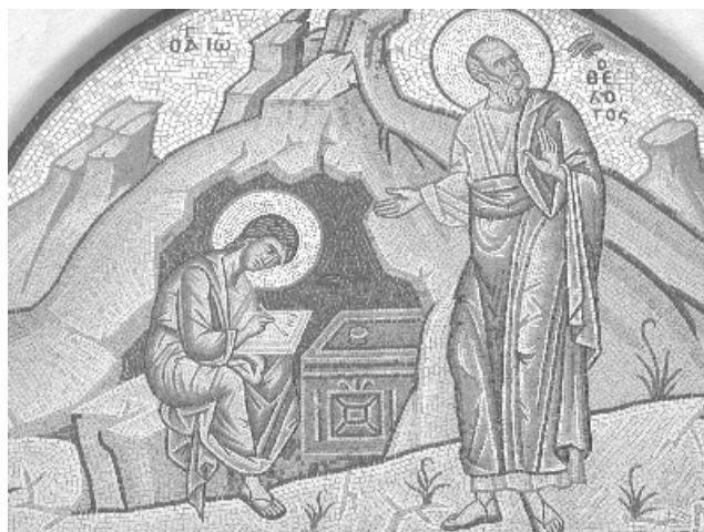
Johannes ontvangt de openbaring

Toch is men in sommige christelijke kringen er nog steeds heilig van overtuigd dat alles strikt voorbestemd is. Gereformeerden, in het bijzonder de Calvinisten, geloven zelfs dat het vanaf het begin vast staat of een mens na zijn dood in de hemel of in de hel terecht komt. Dientengevolge zijn mensen eigenlijk slechts marionetten in een spel dat God eeuwen geleden minutieus uitgedacht heeft en dat voor ons, zonder dat we doel en zin begrijpen, gespeeld wordt, totdat uiteindelijk het doek valt. Deze mening staat echter haaks op de christelijke leer van vrije wil en keuzevrijheid van de mens, een vooral in de katholieke kerk bijna dogmatisch thema. Omdat de bijbel voor beide meningen voldoende bewijs levert, zal de discussie over dit thema ook binnen de kerken zeker doorgaan.